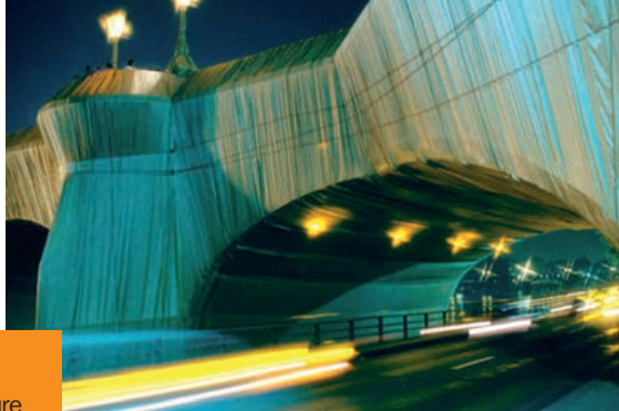
Christo, Emballage du Pont-Neuf à Paris