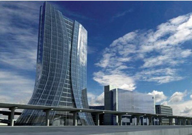
Zaha Hadid, La tour CMA-CGM à Marseille

● De 18h30 à 20h Cinéma Le Coluche allées Jean Jaurès à Istres. Entrée gratuite sur présentation de la carte d'adhérent